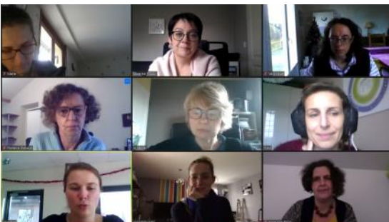
Réunion mensuelle en visio - On garde le lien

De plus en plus d'actions collectives se mettent en place avec la coopérative mère à Bourg-en-Bresse, afin de permettre aux entrepreneurs de se faire connaître et de développer leur projet. Aujourd'hui Elan Création et Ess'Ain, ce sont plus de 75 entrepreneurs. Pendant cette crise, Elan Création a également pu compter sur ses partenaires qui ont tous renouvelé leur confiance pour 2020.