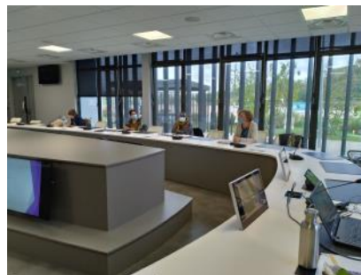
Atelier Argumentation commerciale