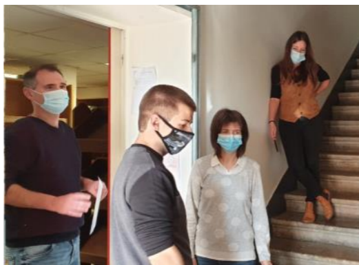
Candidat et jury lors du passage du CQP Salarié polyvalent