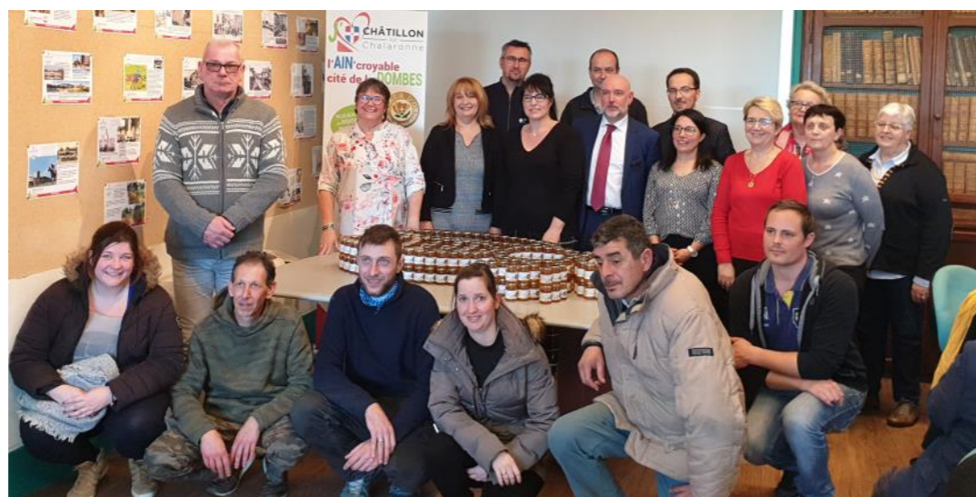
Invitation de l'équipe des Ateliers de Châtillon par la mairie de Châtillon-sur-Chalaronne lors de la signature de la convention avec GRDF autour de l'Apiculture. Cette équipe entretient à l'année l'Arboretum sur lequel est implanté le Rucher pédagogique.

« J'ai 35 ans. Quand je suis arrivée au Chantier Insertion, je n'avais aucun revenu et j'étais dans une situation administrative très compliquée. J'ai pu exposer toutes mes difficultés et de nombreuses réponses sont arrivées. J'ai obtenu une aide de Pôle Emploi pour m'aider à financer le permis de conduire et j'ai suivi une formation de 42 heures pour l'apprentissage du Code de la Route (grâce à une formation organisée par le Chantier Insertion et LUSIE). Je travaille dans une équipe d'entretien d'Espaces Verts et j'ai découvert un métier qui m'intéresse beaucoup. En 2021, je vais préparer le CQP d'employé polyvalent pour obtenir une Certification car je n'ai aucun diplôme, et effectuer des périodes de Mise en Situation en Milieu Professionnel pour vérifier deux projets qui me tiennent à cœur : le service en restauration et le métier d'ouvrier paysagiste. On m'écoute, on m'encourage, je vois que je progresse ».