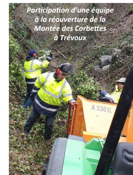
Participation d'une équipe à la réouverture de la Montée des Corbettes à Trévoux